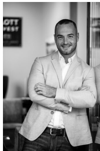
Vass Apor Értékesítés és Bérbeadás

Amennyiben további kérdése merül fel forduljon hozzám bizalommal.