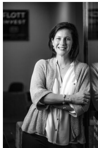
Palla Gréta Értékesítés és Bérbeadás

Amennyiben további kérdése merül fel forduljon hozzám bizalommal.