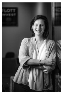
Palla Gréta Értékesítés és Bérbeadás

Amennyiben további kérdése merül fel forduljon hozzám bizalommal.