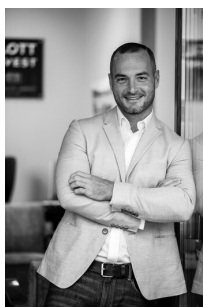
Vass Apor Értékesítés és Bérbeadás

Amennyiben további kérdése merül fel forduljon hozzám bizalommal.