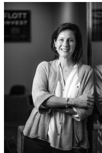
Palla Gréta Értékesítés és Bérbeadás

Amennyiben további kérdése merül fel forduljon hozzám bizalommal.