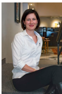
Palla Gréta Értékesítés és Bérbeadás

Amennyiben további kérdése merül fel forduljon hozzám bizalommal.